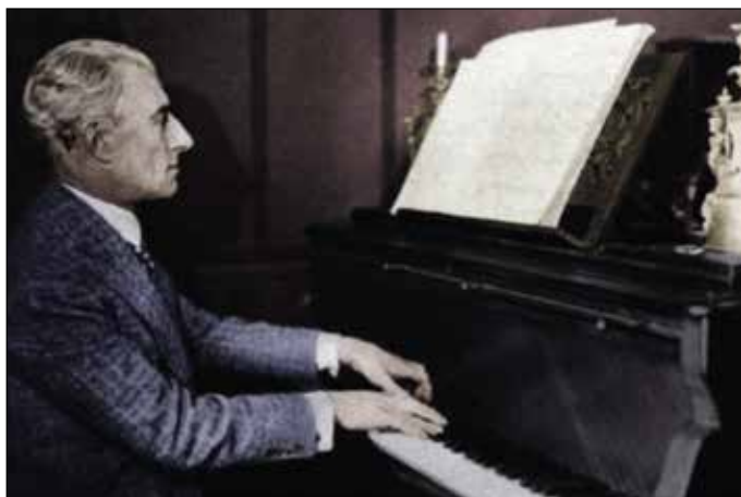
Maurice Ravel au piano

Considérée par Ravel comme l'une de ses œuvres les plus difficiles à interpréter, la partition originale porte une citation de l'écrivain Henri de Régnier, évoquant « le plaisir délicieux et toujours nouveau d'une occupation inutile... ».