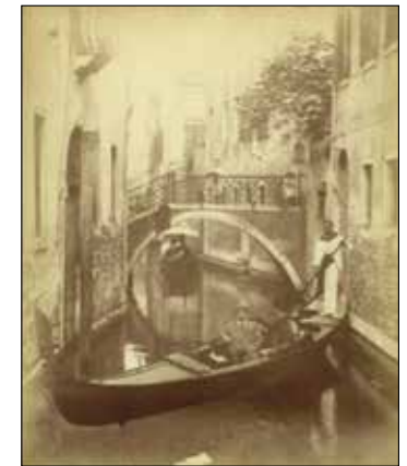
Reynaldo Hahn à Venise