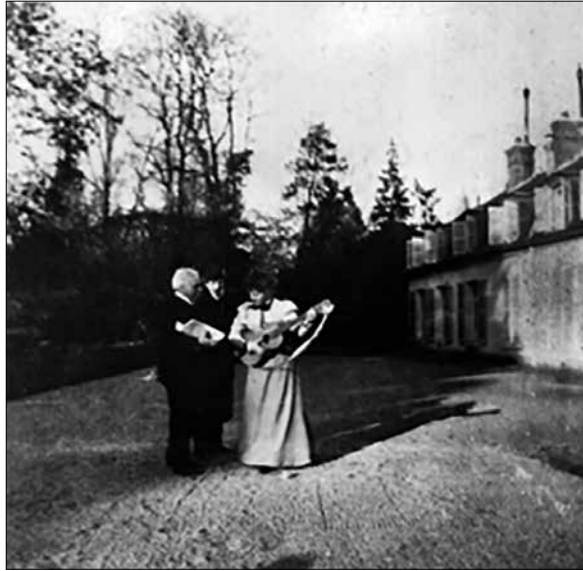
Gabriel Fauré, le prince Edmond de Polignac et Winnaretta Singer-Polignac devant l'hôtel Polignac, Fontainebleau, vers 1895.